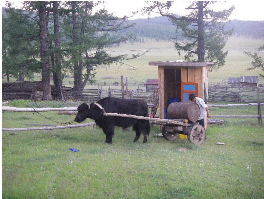
Wasser fürs WC

Anders als der Flugplatz hatte unser Jurtencamp kein Plumpsklo, sondern ein WC. Allerdings wurde von Hand gespült. Dazu musste Wasser von einer großen, blauen Wassertonne in die Kloschüssel geschöpft werden. Das Spannendste war aber, wie das Wasser in die blaue Tonne kam. Es wurde alle ein bis zwei Tage per Ochsenkarren gebracht. Der Karren war nahezu vollständig aus Holz gebaut und hatte Räder, wie Fred Feuersteins Auto.